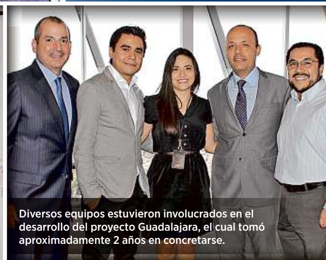
Diversos equipos estuvieron involucrados en el desarrollo del proyecto Guadalajara, el cual tomó aproximadamente 2 años en concretarse.

Con el objetivo de seguir protegiendo a las familias mexicanas y ofrecer una atención cercana y de calidad, Seguros Monterrey New York Life inauguró su nueva casa en Guadalajara.