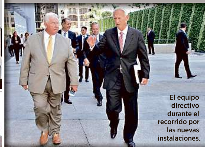
El equipo directivo durante el recorrido por las nuevas instalaciones.

La nueva torre –desarrollada por el despacho Sordo Madaleno Arquitectos– consta de 28 pisos, de los cuales 14 serán ocupados por la aseguradora. La adecuación de las instalaciones, incluyendo mobiliario y el desarrollo con tecnología de punta, implicó una inversión superior a los 200 millones de pesos.