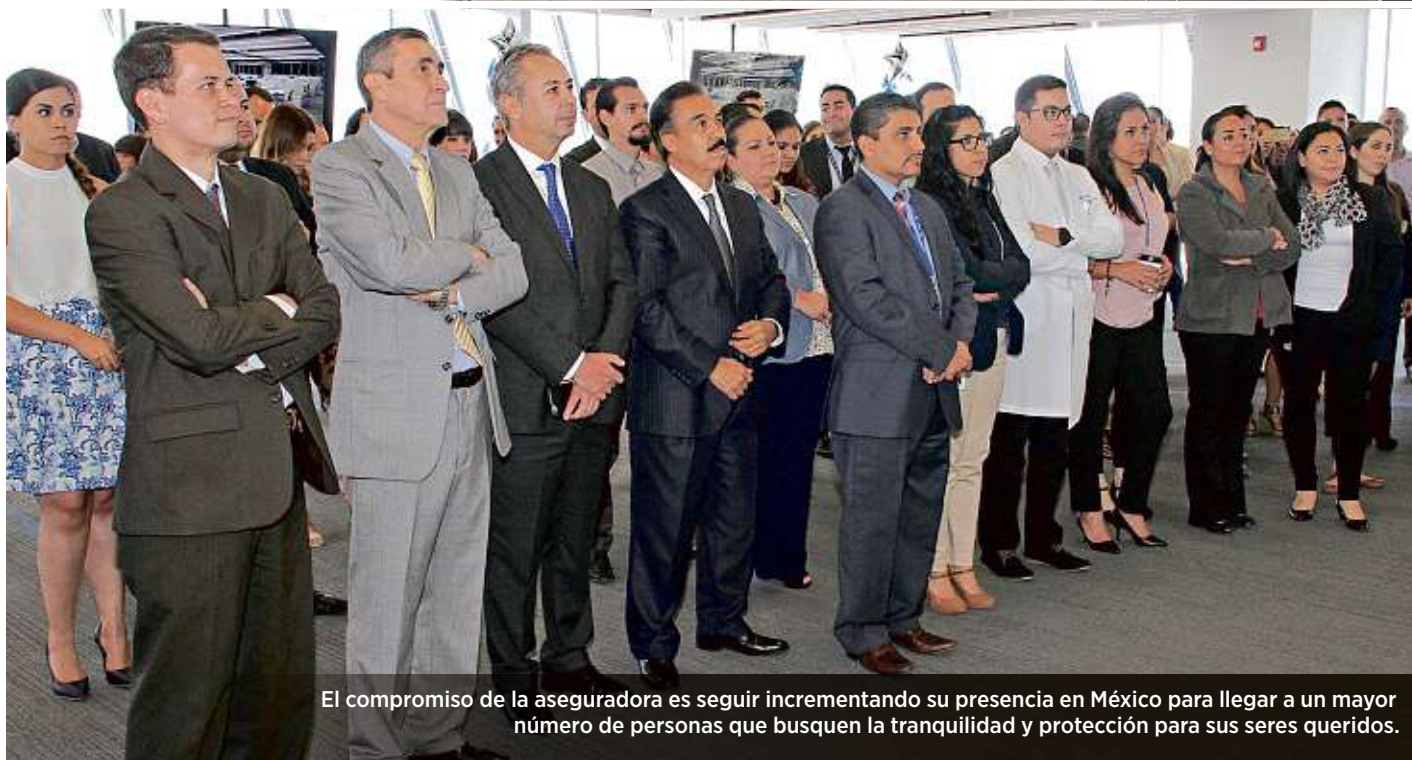
El compromiso de la aseguradora es seguir incrementando su presencia en México para llegar a un mayor número de personas que busquen la tranquilidad y protección para sus seres queridos.